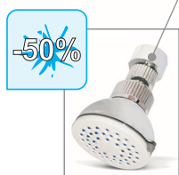
Difusor orientable Diffuser of adjustable