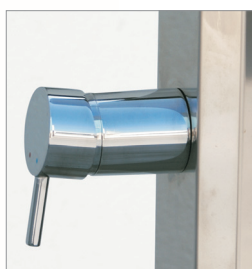
Monomando (caliente y fría) Single-handle (Hot and cold)